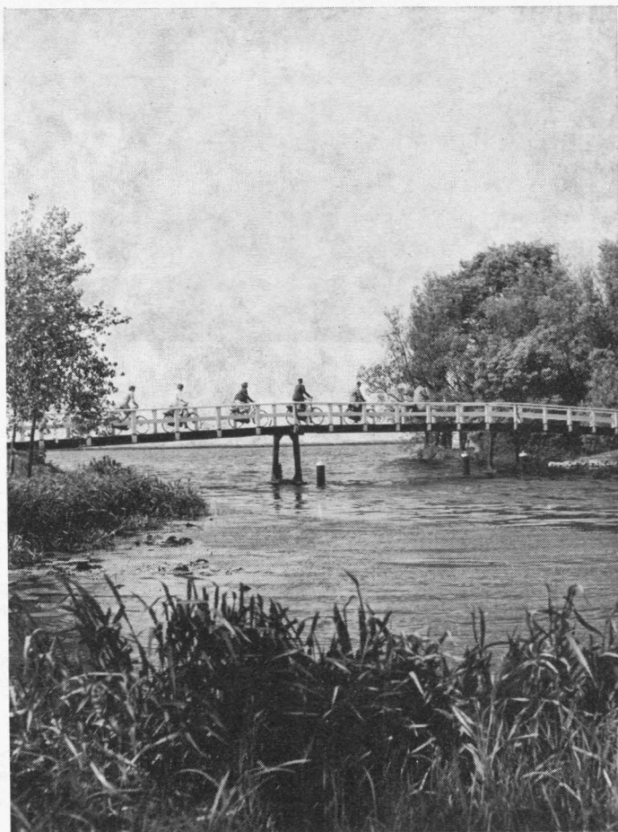
Zo maar een zomers plaatje. Wij bedoelen er niets mee.